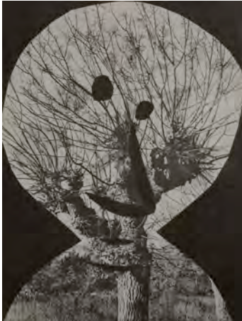
Le corrigan effeuillé, 1962 . Pablo Picasso / Andre Villers.

Estos rostros, creados a partir de cartulinas recortadas que se han ubicado sobre fotografías, juegan con imágenes que crean volumen y texturas. En algunos casos, la imagen de la fotografía parece ser la piel del personaje. Incluso hay detalles de las fotografías que crean ojos, mejillas y nariz.