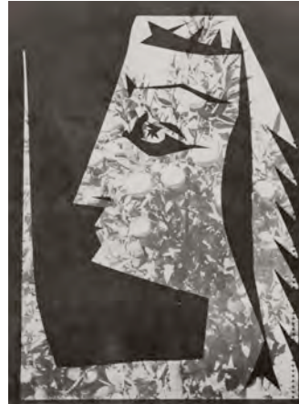
27.- Jacqueline sauz fruits, 1962. Pablo Picasso/ André Villers

Actividad 2: Te invitamos ahora a crear tus propios retratos, tomando como base las imágenes que te entregamos en el anexo 2 .