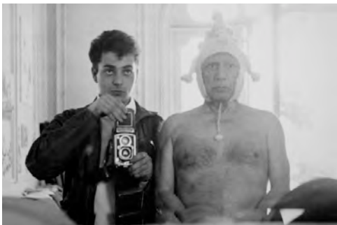
André Villers, con su cámara Rolleiflex y Pablo Picasso. 1962

Una de las primeras cámaras profesionales que tuvo André Villers fue una Rolleiflex que le regaló el propio Pablo Picasso, al enterarse que la suya se había estropeado.