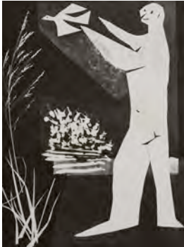
15.-L´homme et l´oiseau. Pablo Picasso /André Villers

Observar las siguientes imágenes. En ellas vemos personajes en blanco que están en diferentes paisajes. Los personajes fueron creación de Pablo Picasso, a través de la técnica del "Découpage", y fueron ubicados sobre paisajes o elementos naturales fotografiados por André Villers.