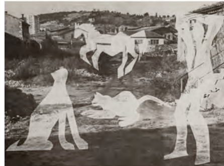
17.- L´homme aux chats II. 1962 Pablo Picasso/ André Villers