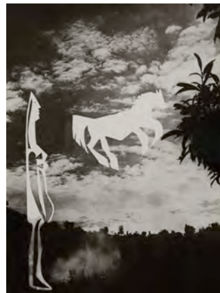
19.- La femme au cheval, 1962 Pablo Picasso / André Viller