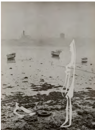
18.- La femme au bord de la mer, 1962. Pablo Picasso / André Villers