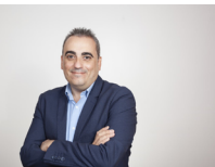
Fco. Javier Corpa Alcalde Presidente